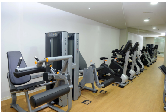
Bicicletas Tanto erguidas como lumbares