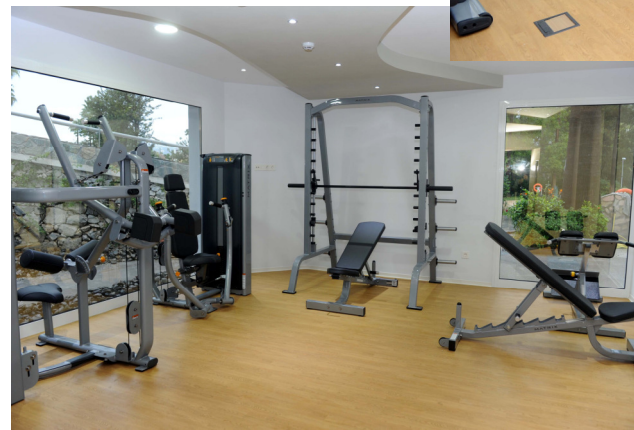
SALA DE MUSCULACIÓN TREN SUPERIOR y PESAS